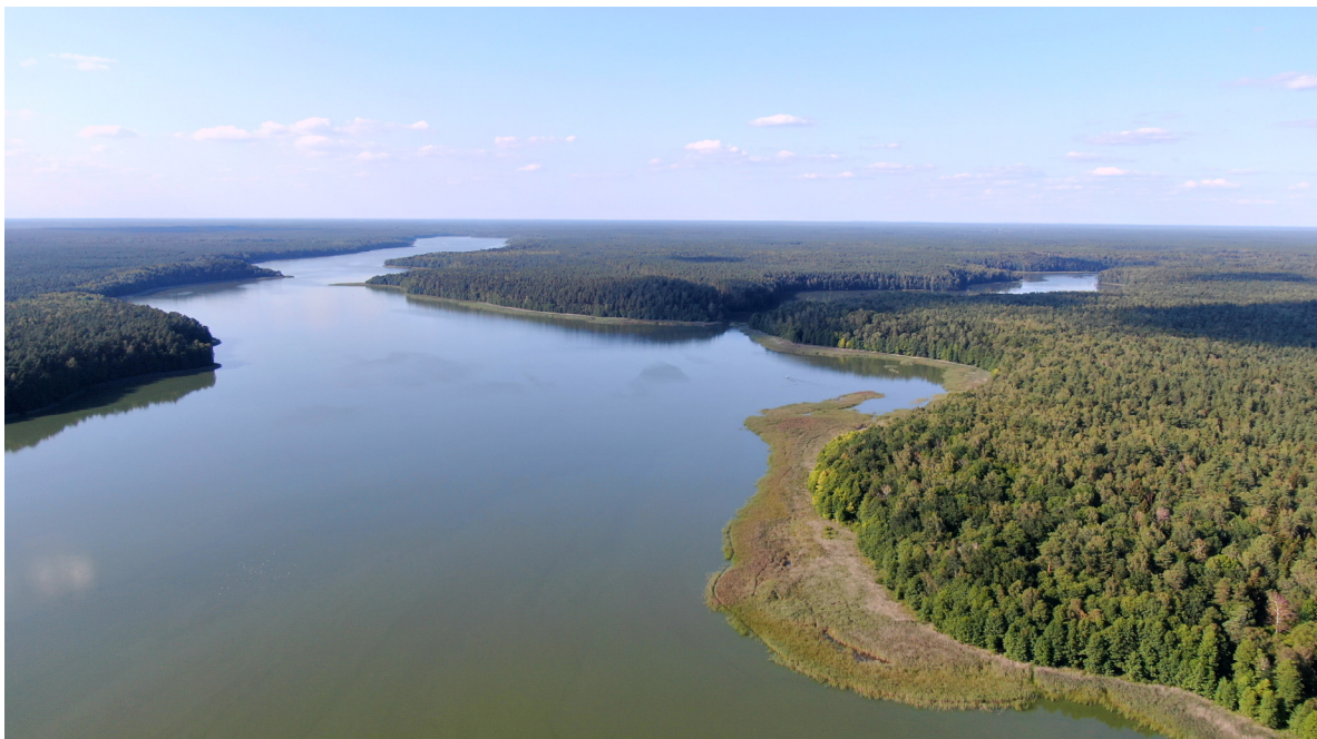
Рисунок 2. — Озеро Белое (Республиканский ландшафтный заказник «Озёры»)