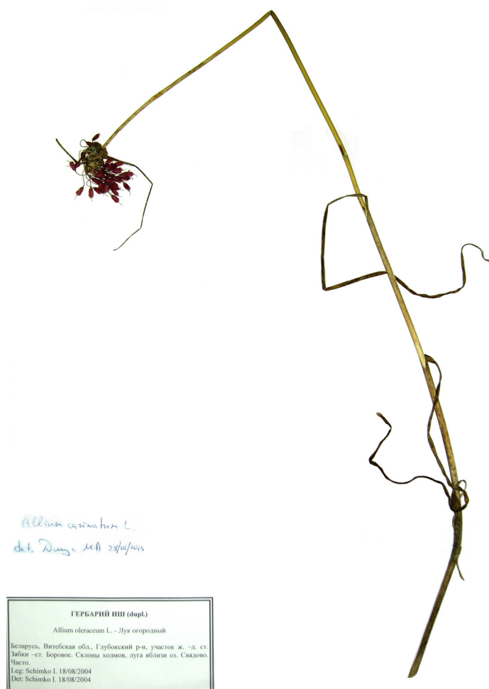
Рисунок 1. — Гербарный образец Allium carinatum с территории Беларуси