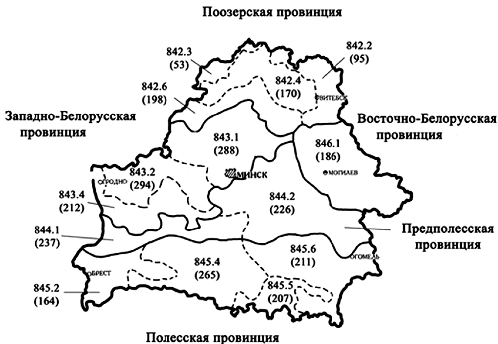
Рисунок 2. — Распределение цикадовых по физико-географическим округам Беларуси

Примечание. В скобках приведено число видов цикадовых, отмеченных в округе.