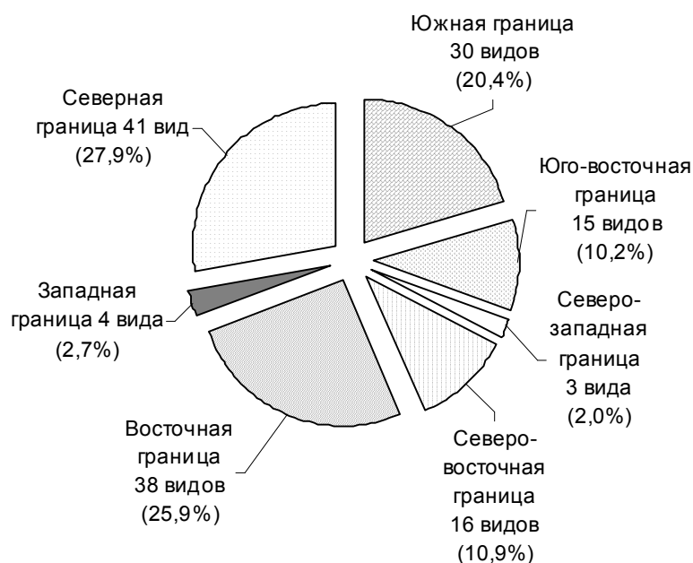
Рисунок 4. — Распределение цикадовых, для которых по территории Беларуси проходят границы ареалов, по группам