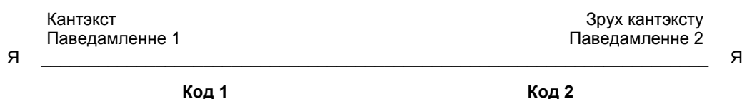
Рысунак 2. — Сістэма «Я—Я» Ю. Лотмана [2, с. 26]