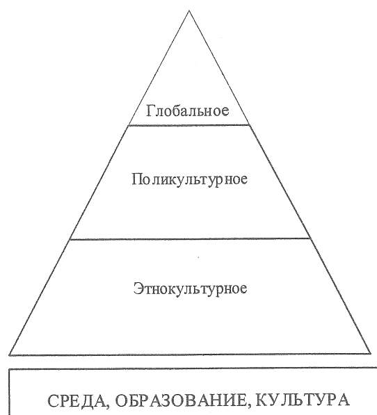
Рисунок 2 — Ступени образования в системе культурных концепций

Концепция этнокультурного образования, получившая распространение в странах СНГ