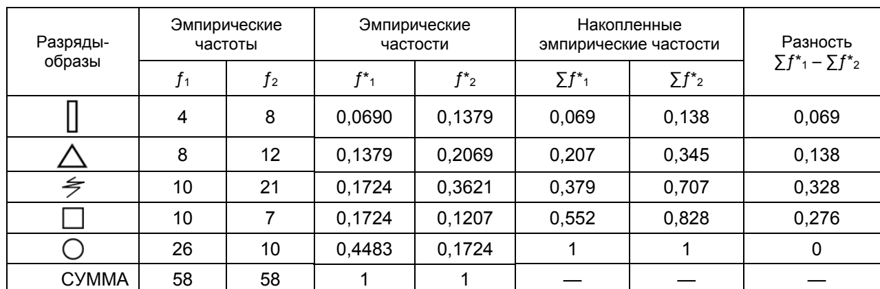
Т а б л и ц а 4. — Результаты сопоставления двух эмпирических распределений структурных компонентов психогометрических образов абстрактных и реальных детей

В дальнейшем полученные результаты были подвергнуты статистической обработке. С применением \lambda -критерия Колмогорова—Смирнова были выявлены достоверные различия по психогометрическим образам (таблица 4).