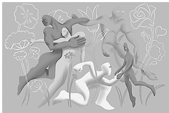
Рисунок 2. — «Ты не один»

Важной темой в программе формировании толерантности к беженцам является «Организация