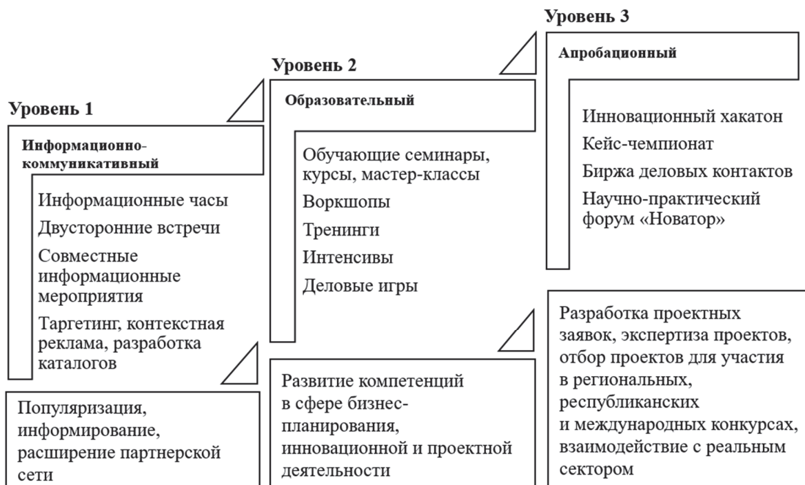
Рисунок 4. — Виды стартап-мероприятий Центра трансфера технологий БарГУ

Примечание — источник: собственная разработка.