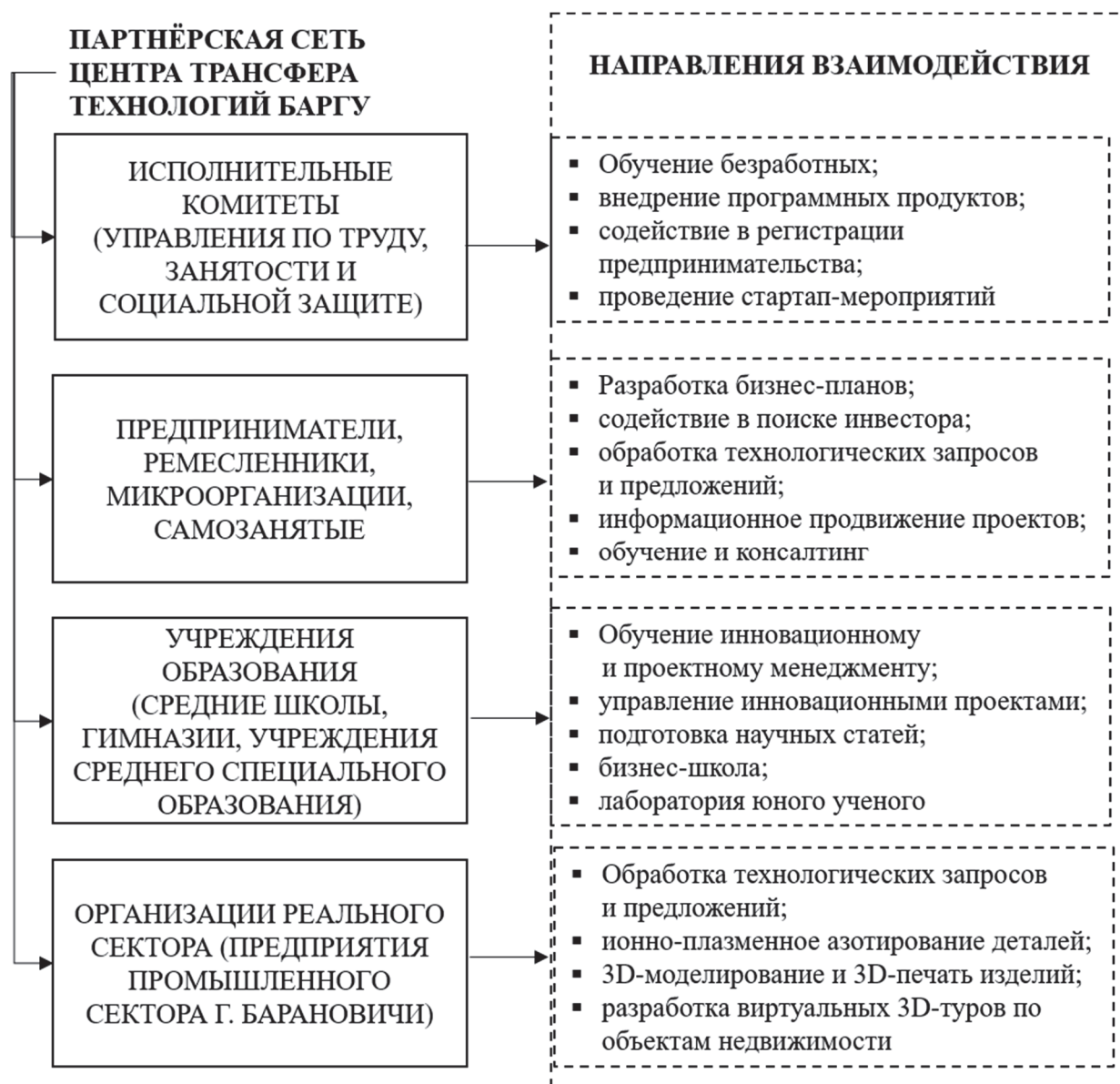
Рисунок 3. — Векторы взаимодействия с основными целевыми группами заказчиков Центра трансфера технологий БарГУ

Примечание — источник: собственная разработка по материалам деятельности Центра трансфера технологий.