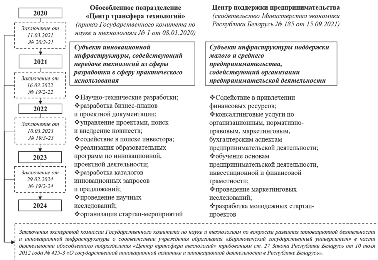
Рисунок 2. — Направления деятельности Центра трансфера технологий и Центра поддержки предпринимательства БарГУ

Предметом деятельности Центра трансфера технологий является осуществление комплекса мероприятий, направленных на передачу новшеств из сферы их разработки в сферу практического применения (рисунок 2). Структура и штат Центра трансфера технологий, а также изменения к ним, определяются штатным расписанием, утвержденным приказом ректора университета. Векторы взаимодействия с целевыми группами заказчиков представлены на рисунке 3.